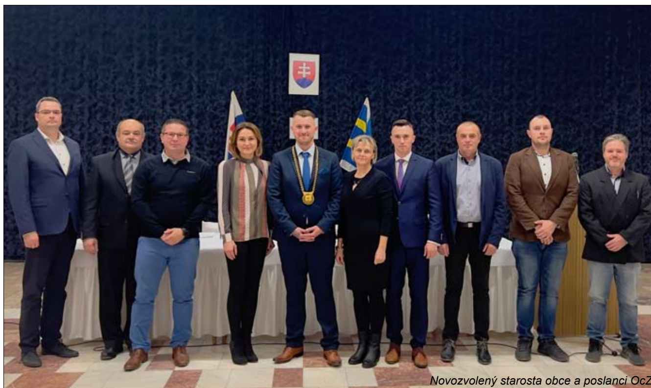
Novozvolený starosta obce a poslanci OcZ

Úplné znenie uznesení nájdete na: www.dolnasuca.sk