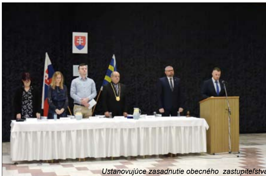
Ustanovujúce zasadnutie obecného zastupiteľstva

Úplné znenie uznesení nájdete na: www.dolnasuca.sk